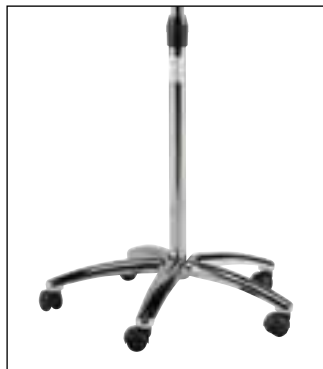
P 9 Piede completo - Complete foot Ø62 P 9/4 Piede completo - Complete foot Ø70