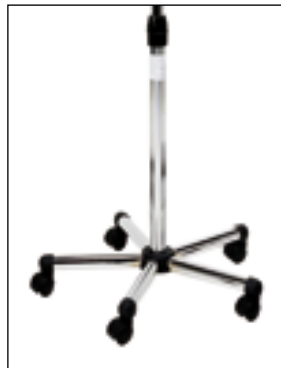
P 6 Piede completo - Complete foot