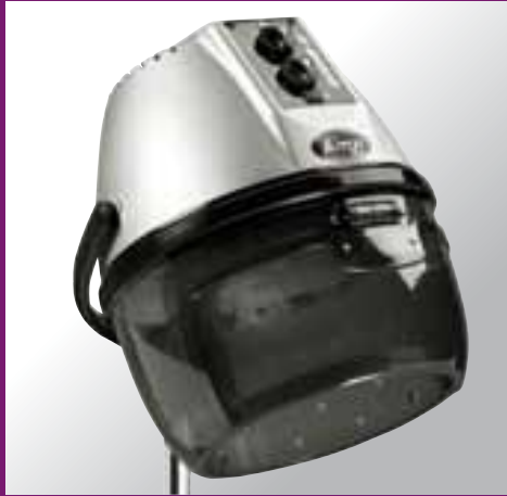
BRIO II 18