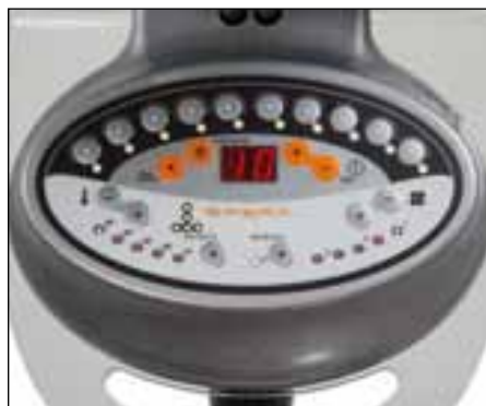
Versione digitale Digital type