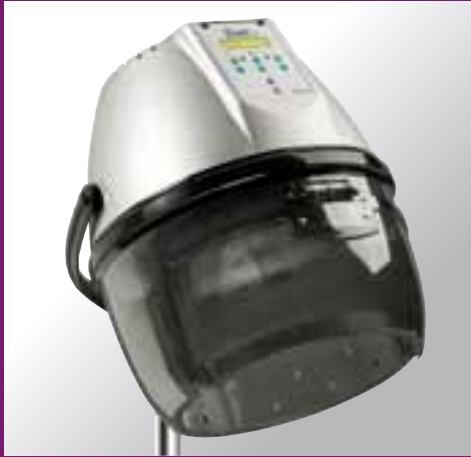
BRIO DIGIT 210