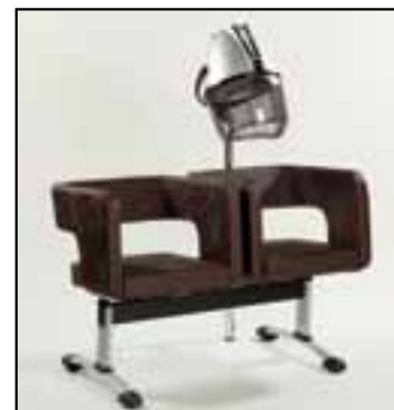
Panchetta con attacco per casco Bench with adaptation to hairdryer