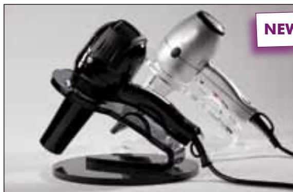
P - POT Porta phon Blowdryer-holder