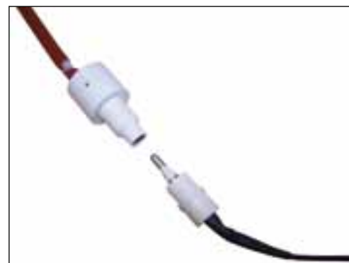
Contatto elettrico rotante - Electric rotating contact