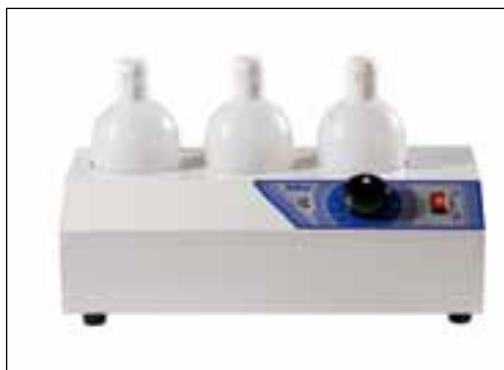
ROXI 610 Scalda shampoo Shampoo warmer