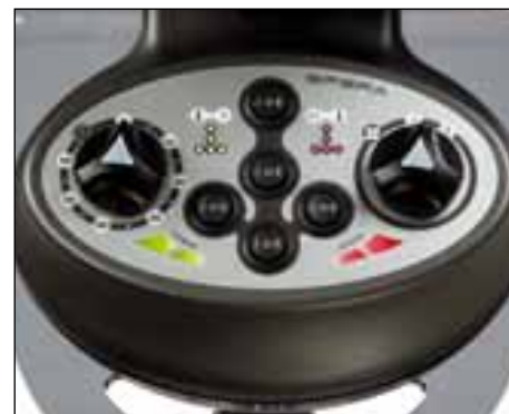
Versione elettromeccanica Manual type