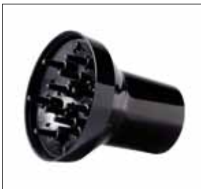
SOFT 917 Diffusore Diffuser