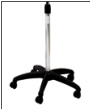
P 8 Piede completo - Complete foot