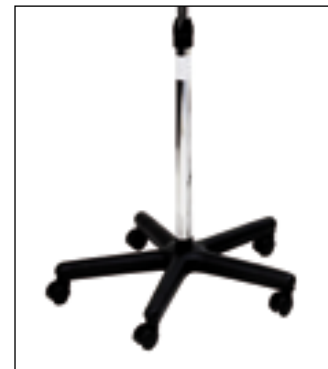
P 8/4 Piede completo - Complete foot