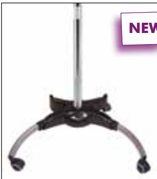
P 11 Piede completo - Complete foot