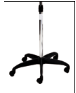
P 5 Piede completo - Complete foot